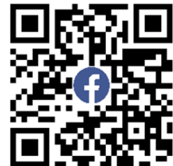
Følg os på Facebook